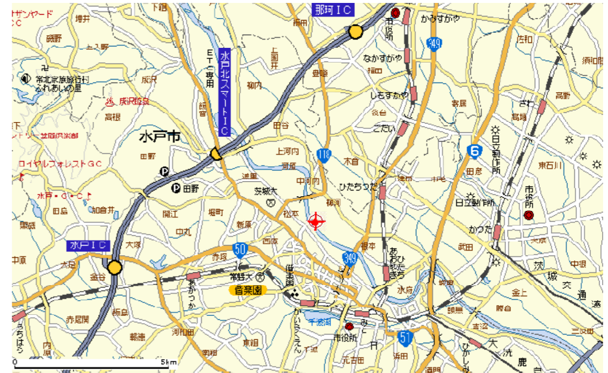
【水戸市柳河市民運動場位置図】

・競技中の事故に対しては大会賠償保険、個人賠償保険(加入者のみ)が適用されますが、自動車運転事故等は適用されませんので、行き帰りの移動の際には安全運転を心がけて下さい