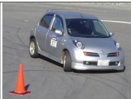
伝説のヴィヴィオ乗りも...