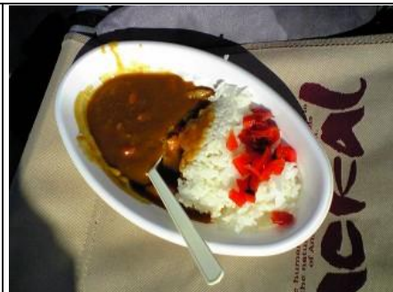
でも... ちゃんと「お弁当付」(喜)