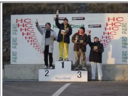
「K祭クラス」の表彰風景