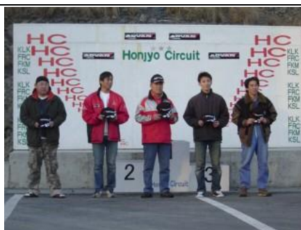
「最高速チャレンジ」に「K-CAR枠」を 設けていただきました(感謝)