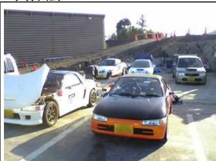
朝は超寒かったですが... 日中は暖かく過ごせました