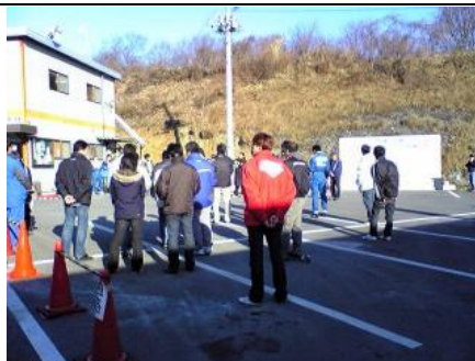
今年は埼群Fesの加-スト Grpクラスに 「K祭クラス」として開催!