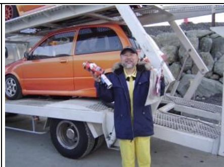
K祭クラスのOverAllは、この方! やっぱり、速い~