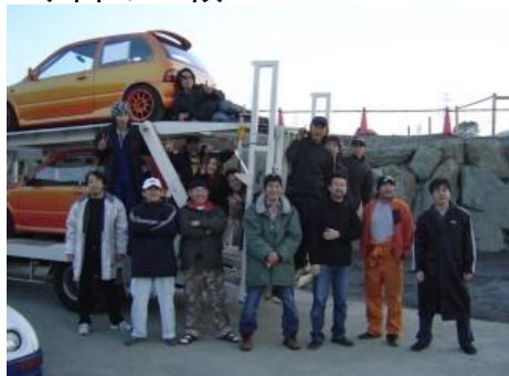
*みなさんお疲れ様でした~(感謝)