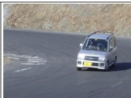
ダイチャレンジャーも激しく走るっ!