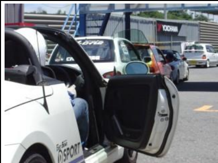
Tクラス：最多14台のエントリー！ エントリーも濃い方々～(^^)；