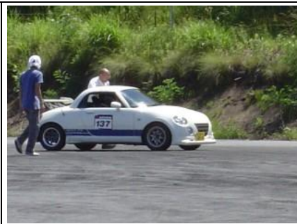
その為、ドラシャ負担大きいのか？ 2台が破損