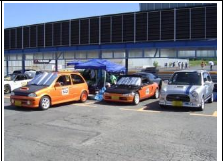
オレンジ軍団の皆様(超～濃い)