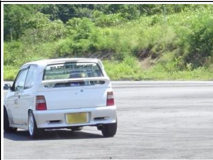
サイドターンが出来ないと辛い... 今年は「4駆殺し」のコース設定(泣)