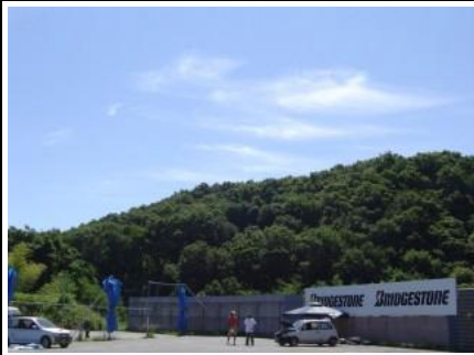
6月とは思えない暑さでした。