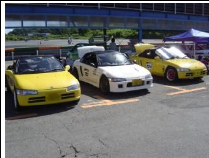
NAクラスも今年も濃い(笑)