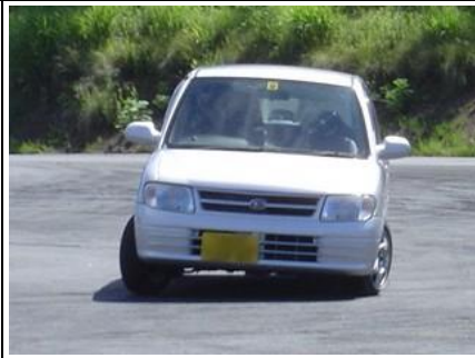
今年もビート相手にがんばれ～