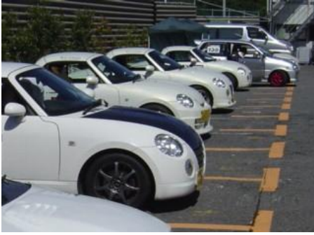
* コペンさん大増殖！5台のエントリー