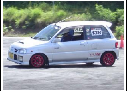
リムタッチしそうな程、攻める！