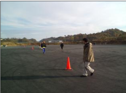
スラローム攻略が今回のポイント