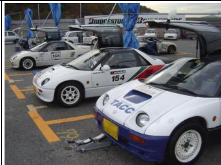
FR2クラスも...濃い方々が...