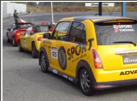
NA1クラス：11台のエントリー！