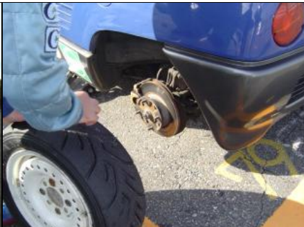
オーバーオール秘策(謎)