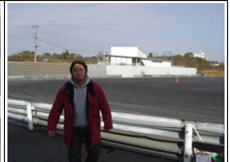
この方はオフィシャルでした