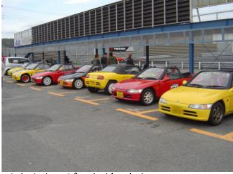
*なんと！ビートが9台も！！