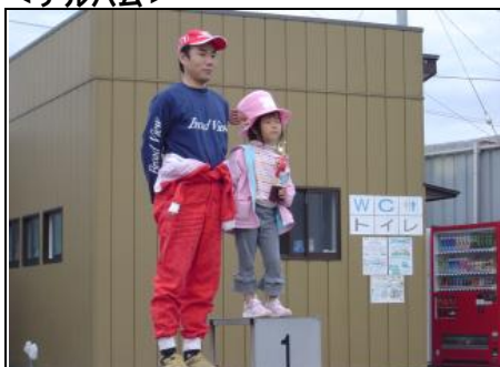
表彰風景「チョッパー登場(^^)」