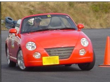
赤いコペンもよいですね