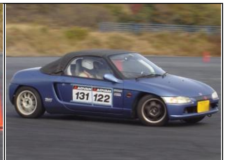
モノアイの色が「黄赤」に