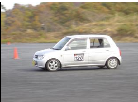
ビート相手にミラで頑張れ！！