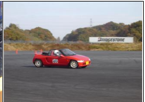
周りの山々も色づいておりました