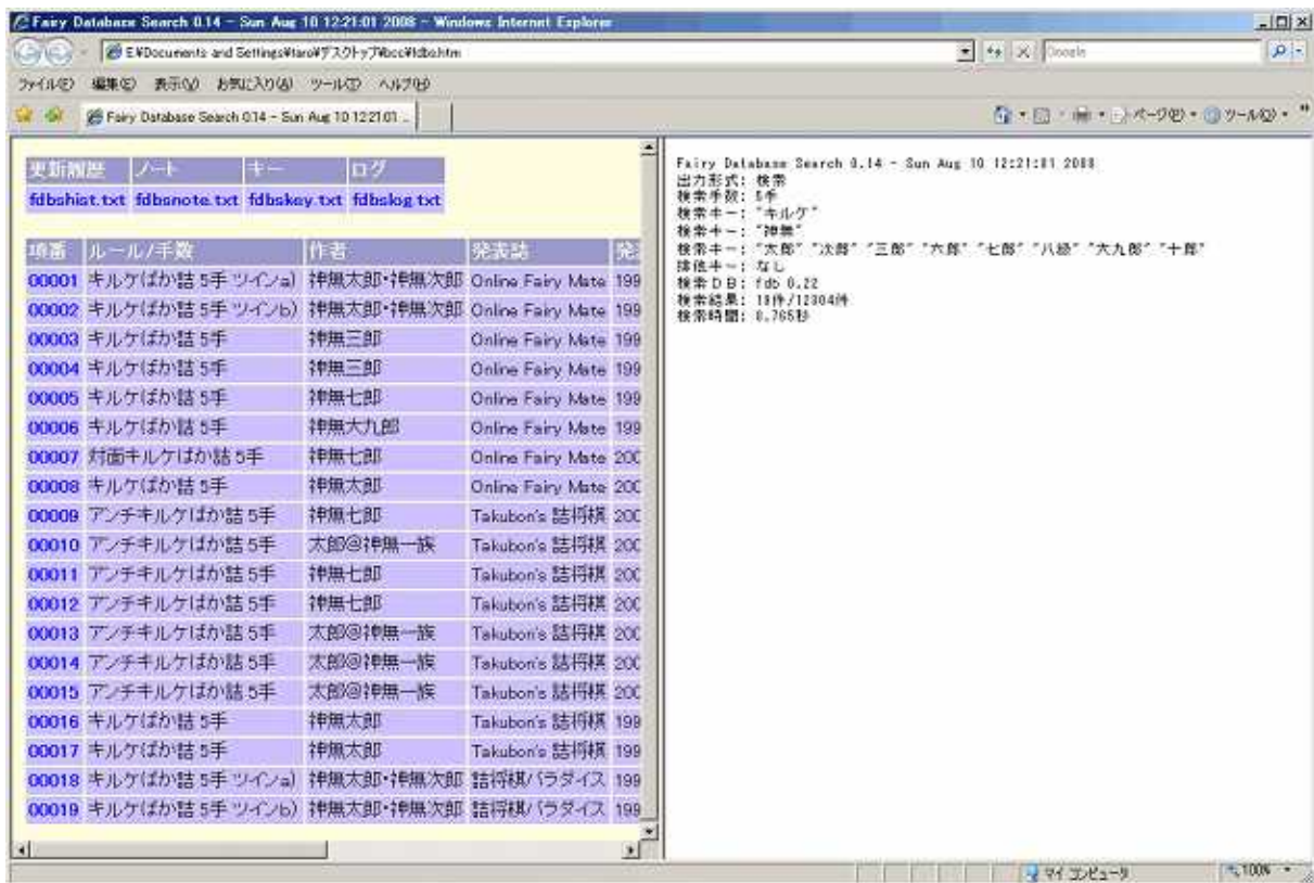
図 2 . fdbs.htmトップページ表示例

トップページの表示例です。左側に検索結果の一覧、右側に検索結果のサマリが表示されます。一覧の項番欄の番号をクリックすると対応するデータが右側に表示されます。