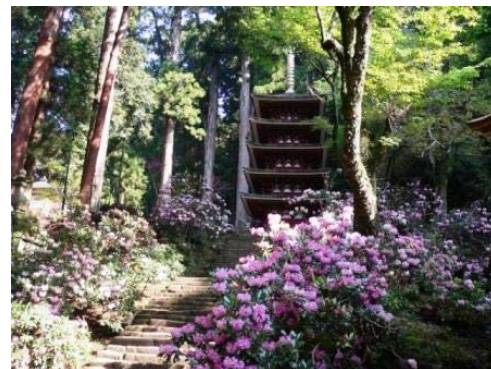
室生寺の五重塔（国宝）

仏隆寺 入山料 200 円、室生寺 拝観料 600 円、大野寺 拝観料 300 円