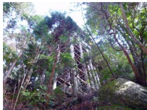
巨岩の上に立つ太神山不動寺

雨天中止の場合は、前日の20時までに「 トミおじさんのホームページ 」に掲載します。確認のためにリーダーが石山駅に行くことはありませんので、ご注意ください。