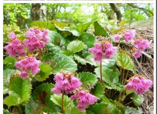
昨年5月8日の現地のイワカガミ