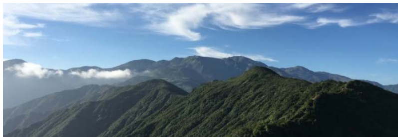
梅海新道の中程から朝日岳方面を振り返る